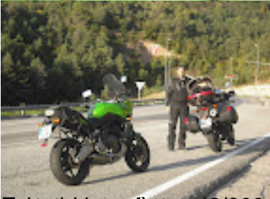
El top de les motes fets (24 d'oct 2008) - Les motes fets (24 d'oct 2008)

El Parc Güell de Barcelona (24 d'agost 2008) - El parc Güell de Barcelona